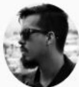
Canal do Moscoso ✓