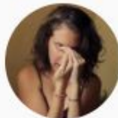
JoutJout Prazer ✓