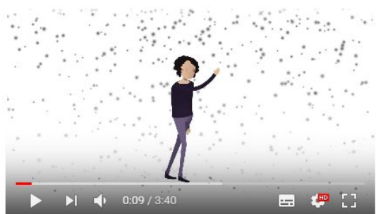
A DEPRESSÃO E EU