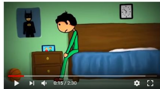
La historia mas triste del mundo