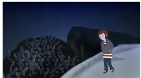
Depressão - animação